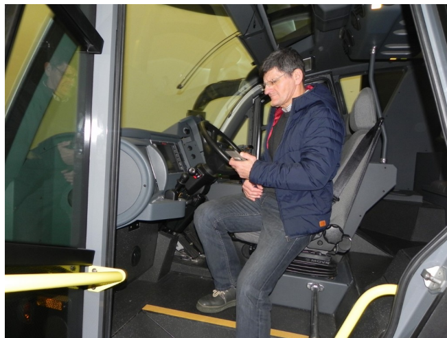
Foto: Simončič, Renko – taktični simulator, Emil opravil z odliko

Sledil je obisk in predstavitev dejavnosti Fraportove letalske akademije, ki skupaj s svojimi partnerji ponuja širok nabor usposabljanj, tako s področja letalstva kot s področja kriznega upravljanja ter zaščite in reševanja. Akademija trenutno izvaja 36 vrst usposabljanj, ki potekajo na različnih lokacijah po Sloveniji, Nemčiji in Bolgariji ter na lokacijah posameznih strank. Vodja akademije nas je popeljal tudi na kratek ogled novega objekta, ki je bil zgrajen z namenom usposabljanja letališkega osebja s celega sveta. Ogledali smo si moderno opremljene učilnice, krizno - komandni center in taktični simulator podjetja Rosenbauer za vožnjo in virtualne rešitve.